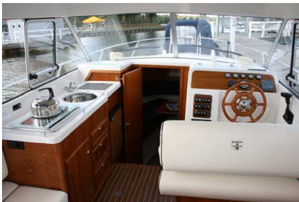
Steuerstand / Küche

komplett abnehmbare Persenning bequeme Badeplattform mit Dusche und Leiter Bugstrahlruder Leicht zu manövrieren